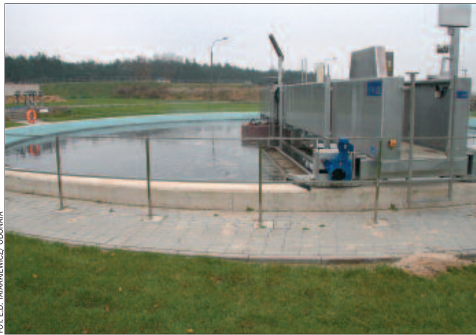
Oczyszczalnie ścieków (jak ta na zdjęciu w Baranowie, gmina Kępno) pozwolą ochronić cenną przyrodę.