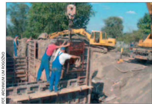
W ramach projektu przewiduje się budowę 369 km sieci kanalizacyjnej. Na zdjęciu podobna inwestycja realizowana w Rogoźnie ze środków ZPORR.