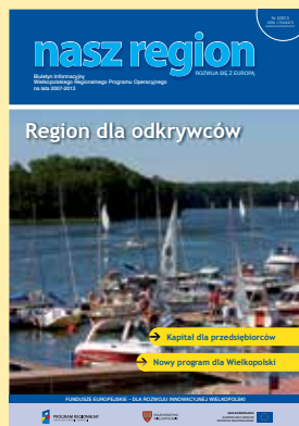
Na okładce: „Europa to my”