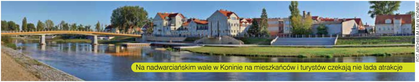
Na nadwarciańskim wale w Koninie na mieszkańców i turystów czekają nie lada atrakcje