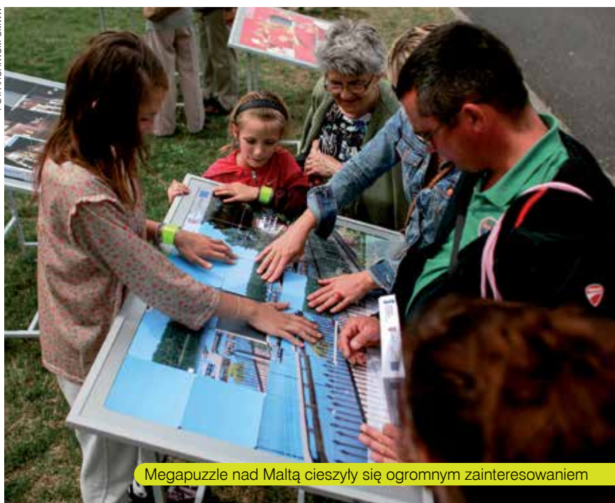
Megapuzzle nad Maltą cieszyły się ogromnym zainteresowaniem