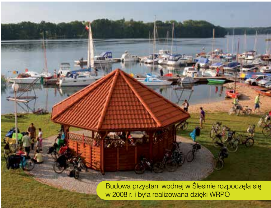
Budowa przystani wodnej w Ślesinie rozpoczęła się w 2008 r. i była realizowana dzięki WRPO

Swoją miejscowość do konkursu mógł zgłosić każdy. Nagrodą główną była organizacja Ogólnopolskiego Dnia Funduszy Europejskich, którego zwieńczeniem był koncert transmitowany w TVP1. W Ślesinie wystąpili m.in. Pectus, Andrzej Krzywy (De Mono), Blue Cafe i Mezo. Miasteczko Funduszy Europejskich to nie tylko dobra zabawa