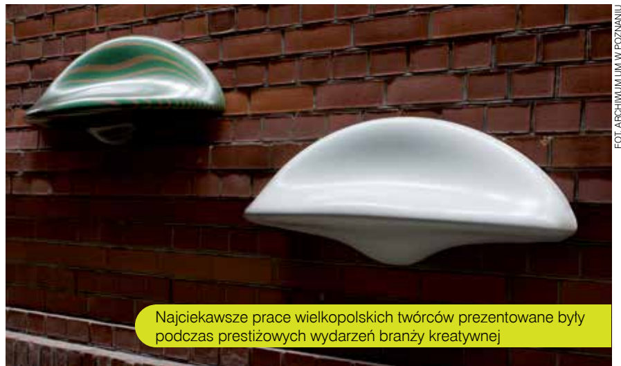
Najciekawsze prace wielkopolskich twórców prezentowane były podczas prestiżowych wydarzeń branży kreatywnej

Czas na Poznań i Wielkopolskę: nasz region ma pod tym względem ogromny potencjał, a jego promocji, także poza granicami Polski, służył projekt „Design z Wielkopolski – promocja kultury regionu”. W jego ramach najciekawsze prace wielkopolskich twórców prezentowane były podczas prestiżowych wydarzeń branży